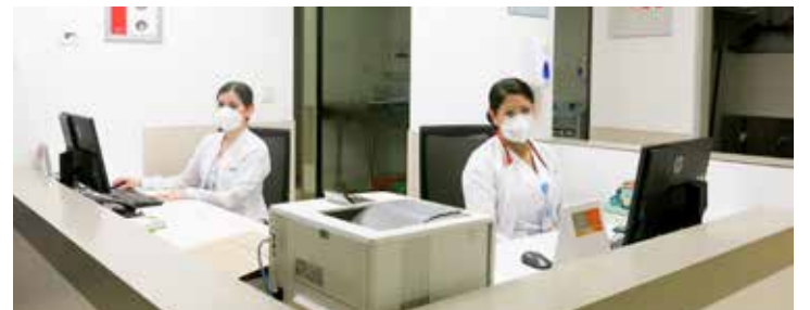
Con su instinto de cuidado al otro, ellas han contribuido no solo al cuidado de los pacientes, sino también al de sus compañeros.