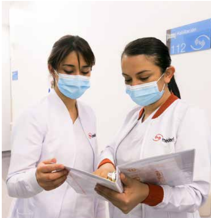
El papel de la mujer en la Méderi siempre ha sido importante, el 39% de ellas ocupan la línea piramidal.

De los 3.075 empleados que tiene Méderi, 2.254 son mujeres, es decir, el 73% del personal es femenino.