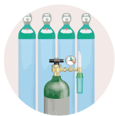
TANQUES O BALAS DE OXÍGENO