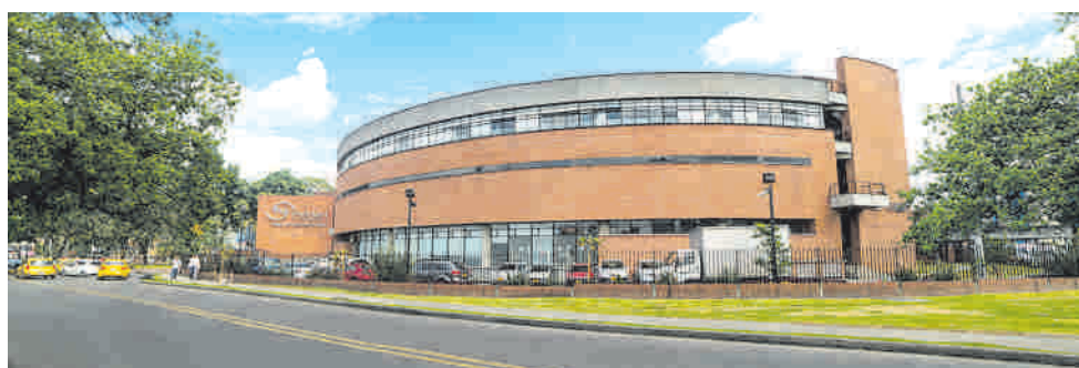
Hospital Universitario Barrios Unidos - HUBU.