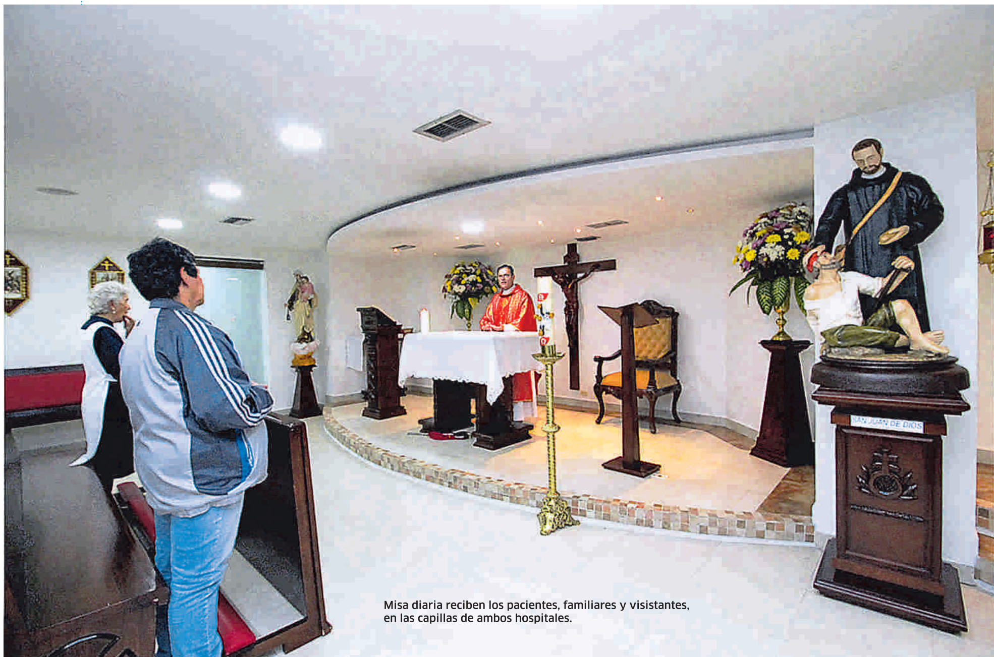
Misa diaria reciben los pacientes, familiares y visitantes, en las capillas de ambos hospitales.

Hace 10 años las convicciones de tres grandes instituciones, movidas por el objeto social, unieron fuerzas para concebir un modelo de atención en salud fundamentado en la humanización y financieramente sostenible.