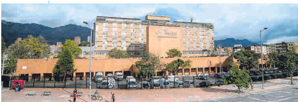
Hospital Universitario Mayor - HUM.

Méderi es una Red Hospitalaria integrada por el Hospital Universitario Mayor - HUM y el Hospital Universitario Barrios Unidos - HUBU, que demuestra cómo desde el sector privado, es posible, a través del servicio, construir tejido social.