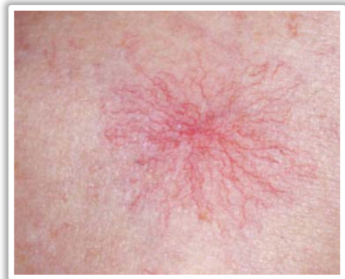
Los nevos en araña pueden ser manejados con Luz Intensa Pulsada.