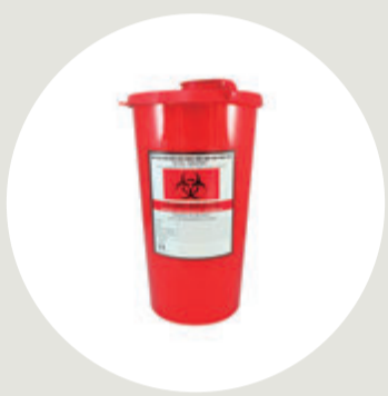
Guardián o contenedor rígido