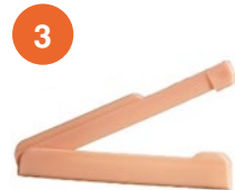
Pinza de cierre